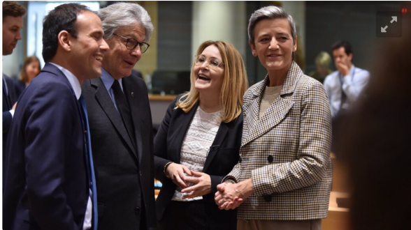
f De EU-landen, de Europese Commissie en het Europees Parlement zijn het

B Door Bright 23 april 2022 03:04 • Aangepast 23 april 2022 04:39